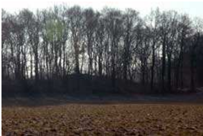
Binnendüne in der „Bremer Schweiz“ (Bremen-Nord)