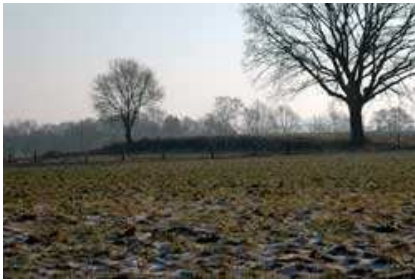
Binnendüne in der „Bremer Schweiz“ (Bremen-Nord)